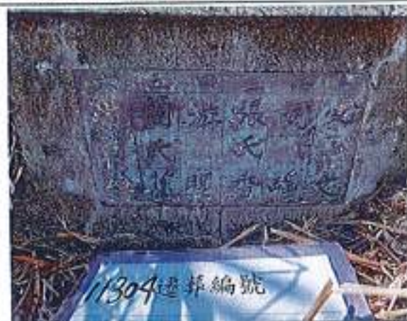
2、受葬姓名牌相片：6人