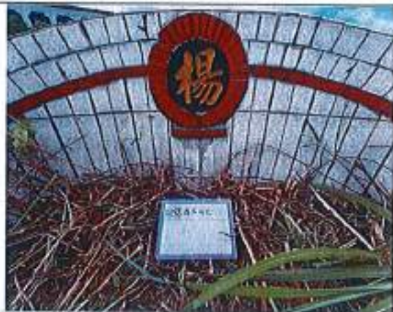
2、受葬姓名牌相片：人