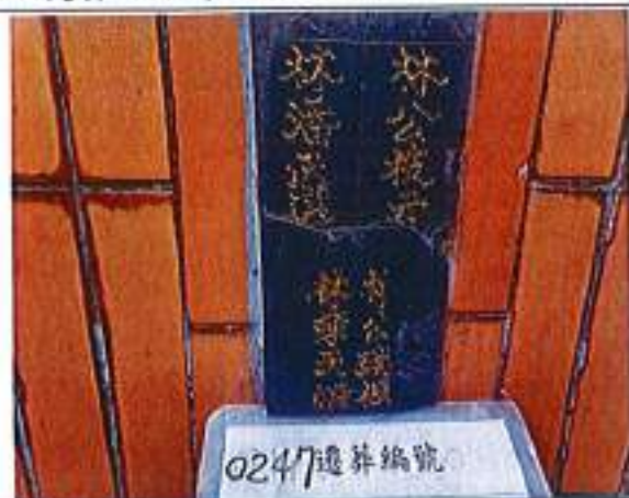
2、受葬姓名牌相片：4人