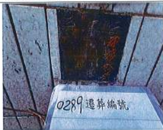
2、受葬姓名牌相片：1人