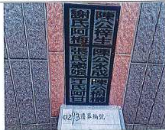
2、受葬姓名牌相片：6人