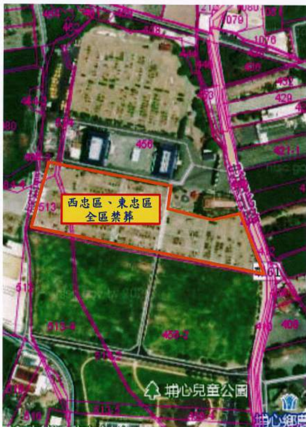
彰化縣埔心鄉第一示範公墓禁葬範圍平面圖