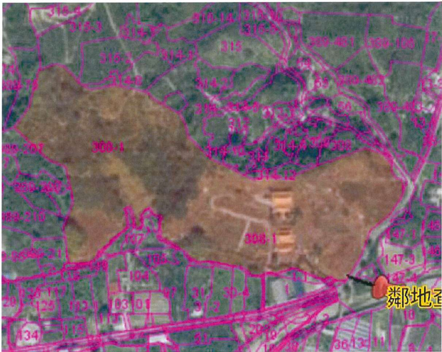
集集鎮柴橋頭段北勢坑小段308-1地號